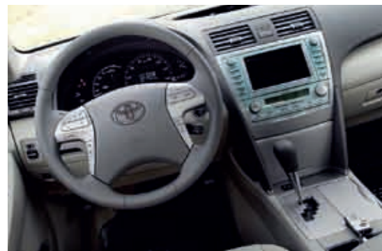
"Energy monitor" är flyttad från centraldisplayen och ner i färrdatorn. Väl ihopskruvad interiör, men med könlösa materialval.